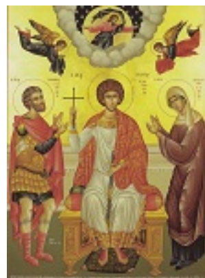
Άγιος Μεγαλομάρτυς Γεώργιος Τροπαιοφόρος μετά των γονέων του