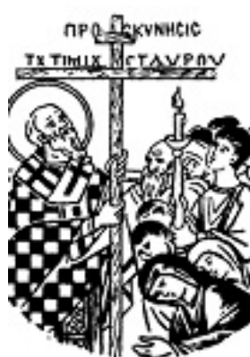
Η προσκύνησις του Τιμίου Σταυρού