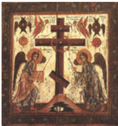
Η προσκύνησις του Τιμίου Σταυρού