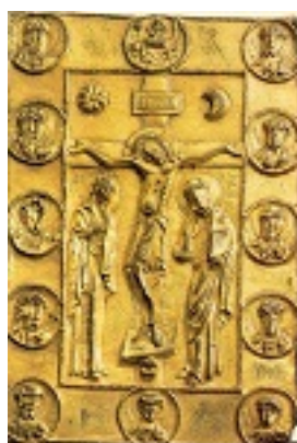
Επένδυση κώδικος (Άργυρος επιχρυσωμένος) - 13ος - 14ος αι. μ.Χ. - Πρωτάτο, Άγιον Όρος