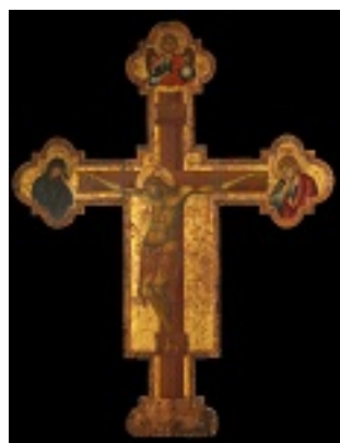
Σταυρός - μέσα 14ου αιώνα μ.Χ.