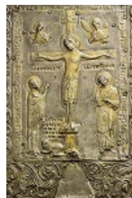
Κάλυμμα σταυροθήκης (Επιχρυσωμένος άργυρος με ανάγλυφο) - 11ος - 12ος αι. και 1758 μ.Χ. - Πρωτάτο, Άγιον Όρος