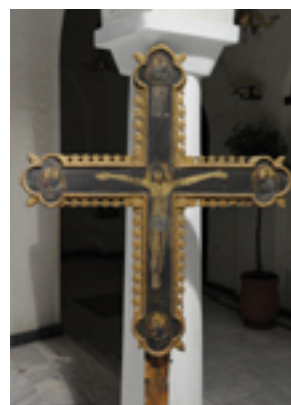
Ο Εσταυρωμένος - 1889 μ.Χ. - Ι.Ν. Ζωοδόχου Πηγής, Λαρίσης ( www.panagialarisis.gr )