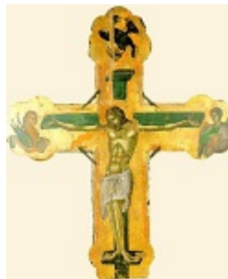
Σταυρός τέμπλου - 1546 μ.Χ. - Μονή Σταυρονικήτα, Άγιον Όρος (Κρητική σχολή, Θεοφάνης ο Κρής)