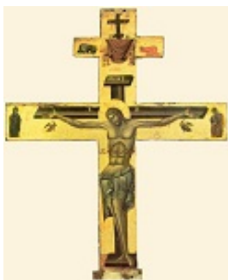
Σταυρός - γύρω στα 1360-1380 μ.Χ. - Μονή Παντοκράτορος, Άγιον Όρος