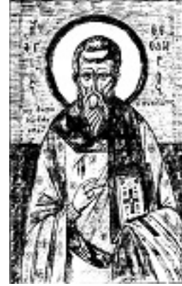
Όσιος Θεόδωρος ο Συκεώτης επίσκοπος Αναστασιουπόλεως - Φώτης Κόντογλου