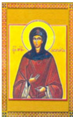
Οσία Αθανασία εξ Αιγίνης η Θαυματουργός