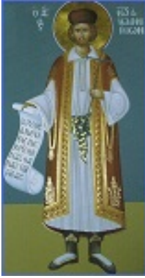
Άγιος Ιωάννης ο Ράπτης ο Νεομάρτυρας εξ Ιωαννίνων