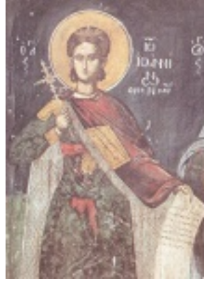
Άγιος Ιωάννης ο Ράπτης ο Νεομάρτυρας εξ Ιωαννίνων