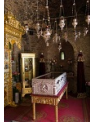
Άγιοι Εκατόν εβδομήντα ενιά Οσιομάρτυρες οι εν τη μονή Νταού Πεντέλης μαρτυρήσαντες (Λειψανοθήκη)