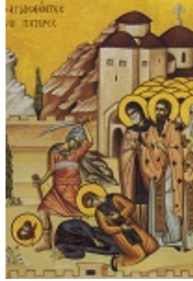
Άγιοι Εκατόν εβδομήντα ενιά Οσιομάρτυρες οι εν τη μονή Νταού Πεντέλης μαρτυρήσαντες