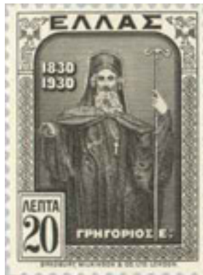
Άγιος Γρηγόριος Ε' Πατριάρχης Κωνσταντινουπόλεως