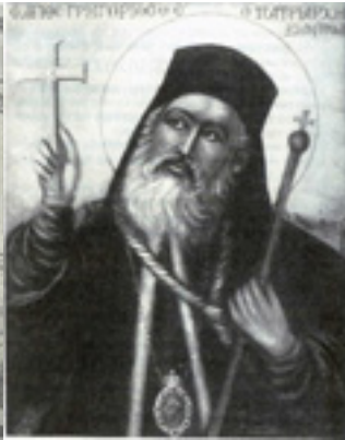
Άγιος Γρηγόριος Ε' Πατριάρχης Κωνσταντινουπόλεως