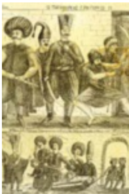
Ο απαγχονισμός του Πατριάρχη Γρηγορίου Ε'