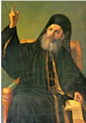
Άγιος Γρηγόριος Ε' Πατριάρχης Κωνσταντινουπόλεως