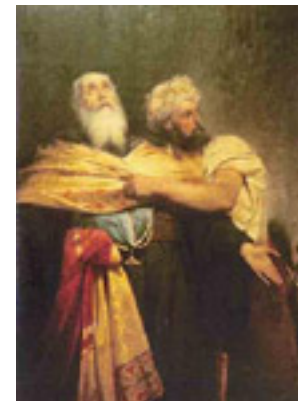
«Ο απαγχονισμός του Πατριάρχη Γρηγορίου Ε'», πίνακας του Νικηφόρου Λύτρα