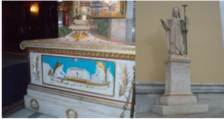
Η λάρνακα του Γρηγορίου του Ε'

Πατριαρχικό και συνοδικό σιγίλλιο του πατριάρχη Γρηγορίου Ε', 1798 μ.Χ. - Αρχείο Ιεράς Κοινότητος Αγίου Όρους Πρωτάτο - Στο κάτω μέρος, με γαλάζια μήρινθο, απαιρωρείται η μολύβδινη σφραγίδα του πατριάρχη. - Ο πατριάρχης, φροντίζοντας για την ευταξία και τη βελτίωση όλων των μονών που υπάγονται στη δικαιοδοσία του οικουμενικού θρόνου, ανακαινίζει το «Τυπικό» του Αγίου Όρους που είχε εκδόσει στα 1783 ο εκ των προκατόχων του πατριάρχης Γαβριήλ Δ'. Μεριμνώντας για τη λειτουργία της Σχολής του Αγίου Όρους, ορίζει την εκ μέρους της Μεγάλης Εκκλησίας οικονομική ενίσχυση της Σχολής με 375 γρόσια. Οι επιστάτες της Ιεράς Κοινότητος θά εκλέξουν δύο έγκριτους μοναχούς ως επιτρόπους του σχολείου, οι οποίοι και θά μεριμνούν για τη συλλογή κάθε χρόνο άλλων 625 γροσίων από τις μονές, ώστε το συνολικό ποσό των 1000 γροσίων να επαρκεί για τη μισθοδοσία των διδασκάλων και για τις λειτουργικές δαπάνες.