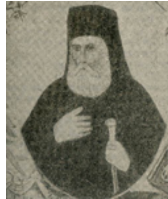
Άγιος Γρηγόριος Ε' Πατριάρχης Κωνσταντινουπόλεως