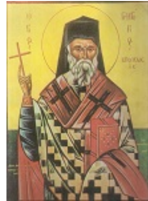
Άγιος Γρηγόριος Ε' Πατριάρχης Κωνσταντινουπόλεως