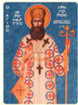
Άγιος Γρηγόριος Ε' Πατριάρχης Κωνσταντινουπόλεως