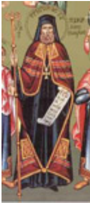
Άγιος Γρηγόριος Ε' Πατριάρχης Κωνσταντινουπόλεως