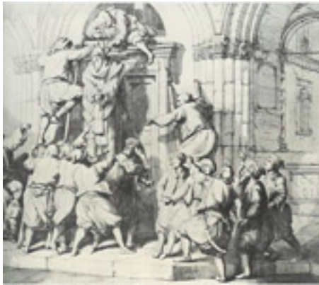
Ο απαγχονισμός του Πατριάρχη Γρηγορίου Ε΄