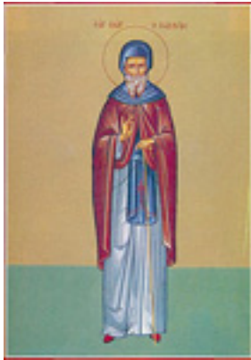
Όσιος Γεώργιος ο Χοζεβίτης