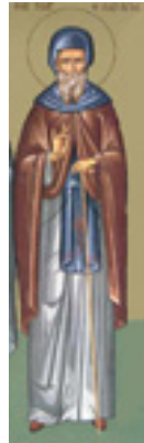
Όσιος Γεώργιος ο Χοζεβίτης