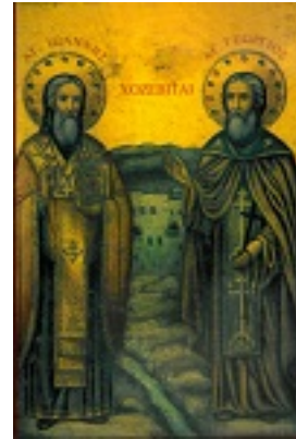
Οι Άγιοι Χοζεβίται