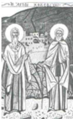
Οι Άγιοι Χοζεβίται