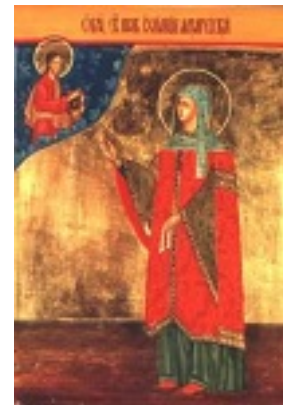
Οσία Ιουλιανή η Δικαία