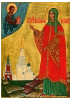
Οσία Ιουλιανή η Δικαία