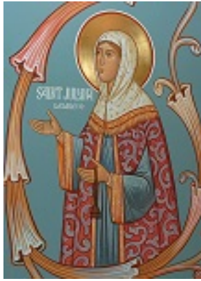
Οσία Ιουλιανή η Δικαία