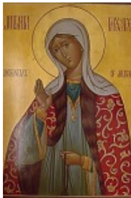
Οσία Ιουλιανή η Δικαία