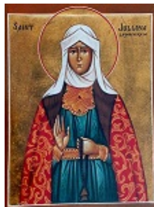
Οσία Ιουλιανή η Δικαία