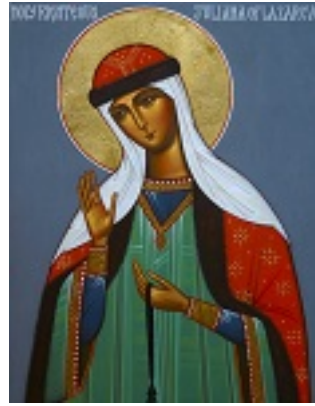
Οσία Ιουλιανή η Δικαία