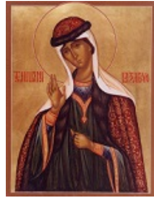
Οσία Ιουλιανή η Δικαία