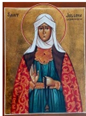
Οσία Ιουλιανή η Δικαία