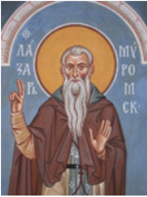
Όσιος Λάζαρος εκ Ρωσίας