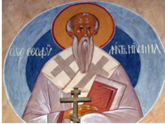
Όσιος Θεοφύλακτος Επίσκοπος Νικομήδειας