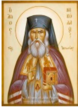
Άγιος Νικόλαος ο Ισαπόστολος - Julia Hayes© (www.ikonographics.net)