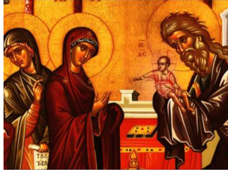
Ακούστε το απολυτίκιο!