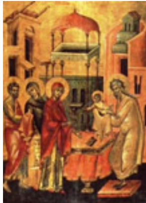
Η Υπαπαντή του Κυρίου