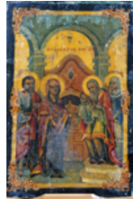
Η Υπαπαντή του Κυρίου - Ι.Ν. Ζωοδόχου Πηγής, Λαρίσης ( http://www.panagialarisis.gr )