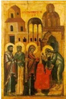
Η Υπαπαντή του Κυρίου - α' μισό 18ου αι. μ.Χ. - Μονή Παντοκράτορος, Άγιον Όρος