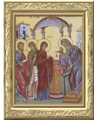
Η Υπαπαντή του Κυρίου