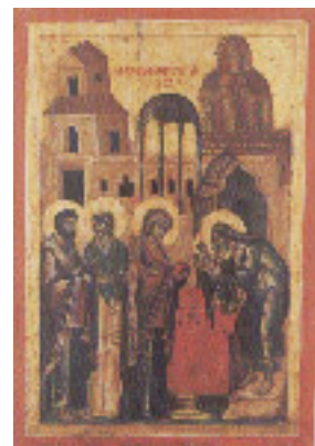
Η Υπαπαντή του Κυρίου