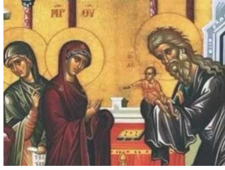
Ακούστε το απολυτίκιο!