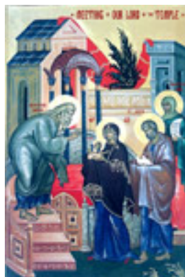
Η Υπαπαντή του Κυρίου