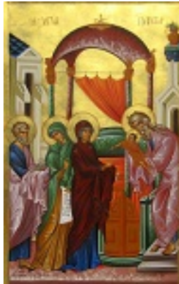
Η Υπαπαντή του Κυρίου - Ι.Ν. Ζωοδόχου Πηγής, Λαρίσης ( http://www.panagialarisis.gr )