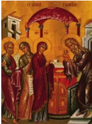
Η Υπαπαντή του Κυρίου