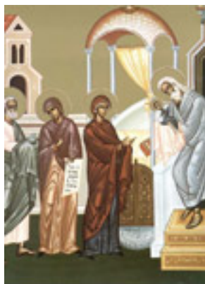
Η Υπαπαντή του Κυρίου