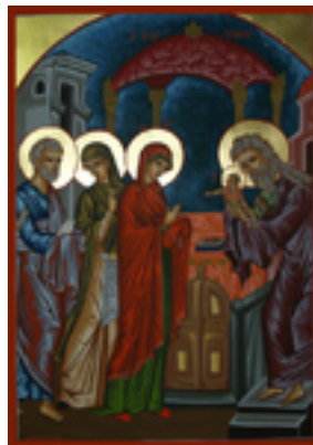
Η Υπαπαντή του Κυρίου - Λυδία Γουριώτη© ( http://lydiagourioti- iconography.blogspot.com )