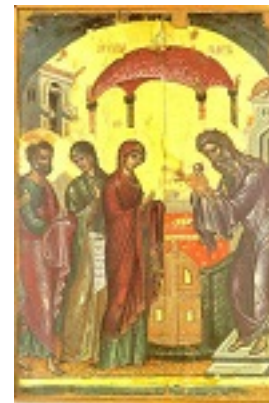
Η Υπαπαντή του Κυρίου - 1546 μ.Χ. - Μονή Σταυρονικήτα, Άγιον Όρος (Κρητική σχολή, Θεοφάνης ο Κρής)