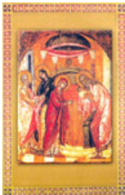
Η Υπαπαντή του Κυρίου