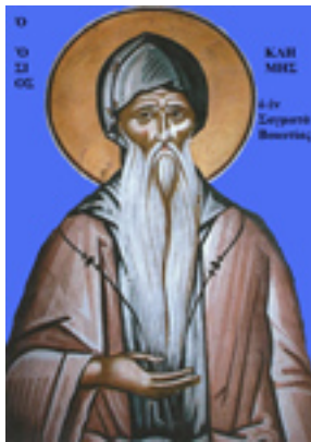
Όσιος Κλήμης ο εν τω Όρει Σαγματιώ άσκησας