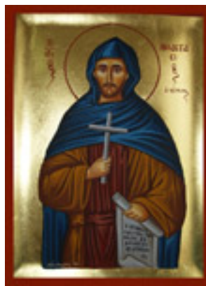
Άγιος Αναστάσιος ο Πέρσης ο Οσιομάρτυρας - Λυδία Γουριώτη© ( http://lydiagourioti- iconography.blogspot.com )