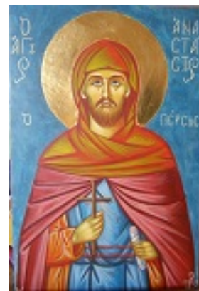
Άγιος Αναστάσιος ο Πέρσης ο Οσιομάρτυρας - Ησυχαστήριο «Παναγία των Βρυούλων»