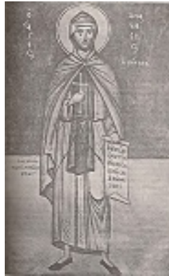
Άγιος Αναστάσιος ο Πέρσης ο Οσιομάρτυρας - Φώτης Κόντογλου