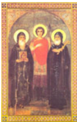
Άγιος Αναστάσιος ο Πέρσης ο Οσιομάρτυρας