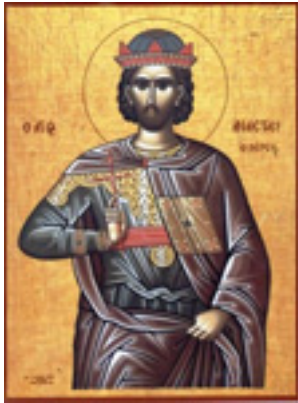
Άγιος Αναστάσιος ο Πέρσης ο Οσιομάρτυρας