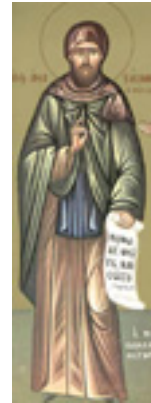
Άγιος Αναστάσιος ο Πέρσης ο Οσιομάρτυρας