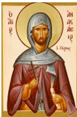
Άγιος Αναστάσιος ο Πέρσης ο Οσιομάρτυρας - Julia Hayes© ( www.ikonographics.net )