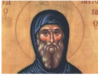
Ακούστε το απολυτίκιο!