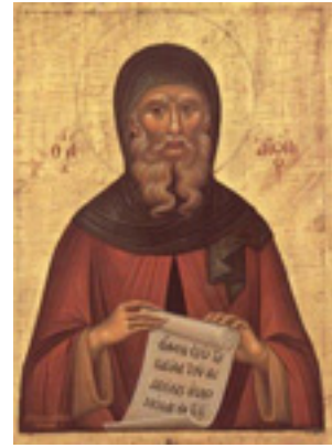
Άγιος Αντώνιος ο Μέγας