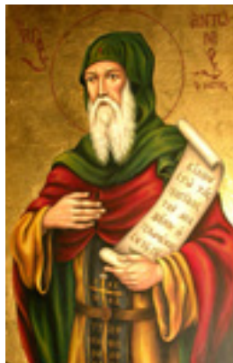
Άγιος Αντώνιος ο Μέγας