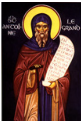
Άγιος Αντώνιος ο Μέγας