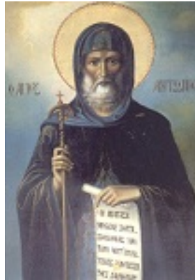
Άγιος Αντώνιος ο Μέγας