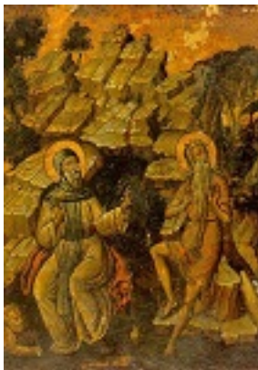
Άγιος Αντώνιος και Άγιος Παύλος ο Θηβαίος - β'μισό του 17ου αι. μ.Χ. - Μονή Ξηροποτάμου, Άγιον Όρος