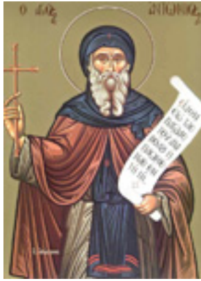
Άγιος Αντώνιος ο Μέγας