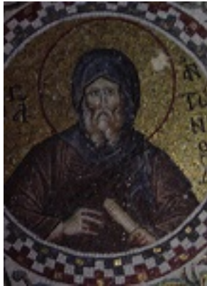
Άγιος Αντώνιος ο Μέγας, Μονή Παμμακάριστου