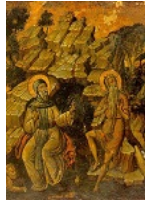
Άγιος Αντώνιος και Άγιος Παύλος ο Θηβαίος - β' μισό του 17ου αι. μ.Χ. - Μονή Ξηροποτάμου, Άγιον Όρος