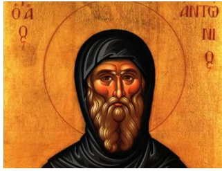
Ακούστε το απολυτίκιο!