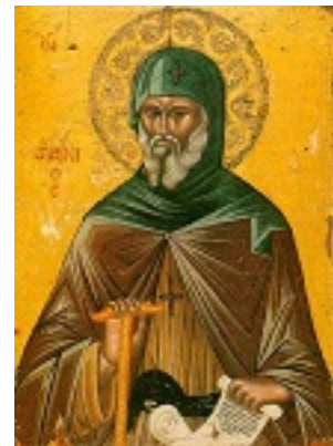
Άγιος Αντώνιος ο Μέγας - 17ος αι. μ.Χ. - Μονή Διονυσίου, Άγιον Όρος