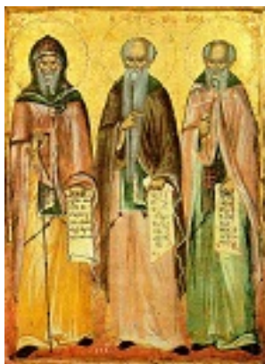
Άγιοι Αντώνιος, Ευθύμιος και Σάββας ο Ηγιασμένος - 1766 μ.Χ. - Νέα Σκήτη, Άγιον Όρος