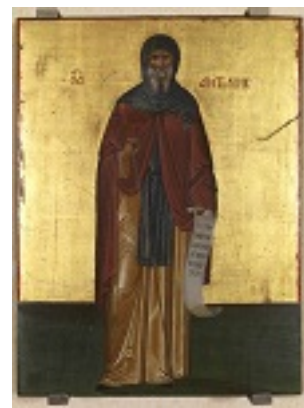
Άγιος Αντώνιος ο Μέγας - άγνωστος ζωγράφος κρητικού εργαστηρίου, τέλη 16ου - αρχές 17ου αιώνα μ.Χ.