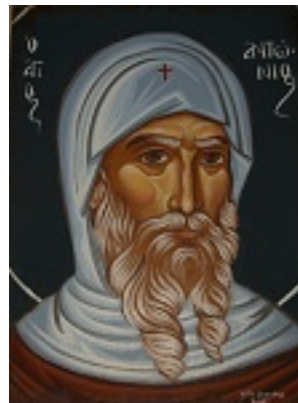
Άγιος Αντώνιος ο Μέγας - Λυδία Γουριώτη© (lydiagourioti- iconography.blogspot.gr)