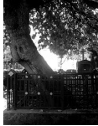
Η μουριά στην οποία σταμάτησε το κάρο με το λείψανο του Οσίου Αντωνίου του Νέου