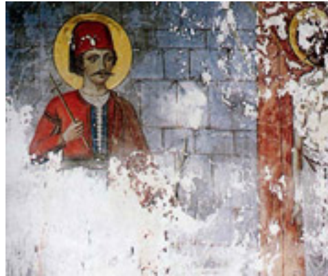
Τοιχογραφία του 1918 μ.Χ. από την Μονή Προφήτη Ηλία του Νησιού των Ιωαννίνων