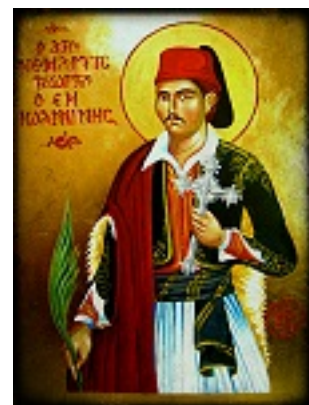
Άγιος Γεώργιος ο Νέος εξ Ιωαννίνων - Χρήστος Στύλος©