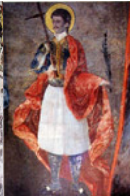
Τοιχογραφία του καθολικού της Μονής Μεταμορφώσεως του Σωτήρα. Η μονή βρίσκεται στα Νοτιοανατολικά της Μονής Ελεούσας