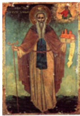
Άγιος Γρηγόριος Επίσκοπος Νύσσης