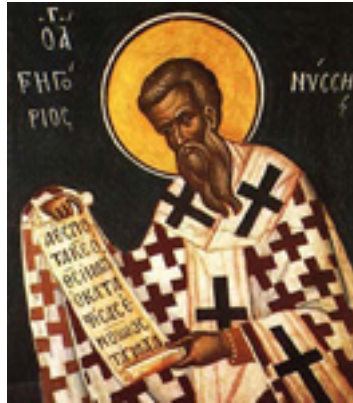
Άγιος Γρηγόριος Επίσκοπος Νύσσης