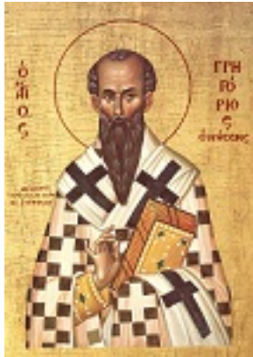
Άγιος Γρηγόριος Επίσκοπος Νύσσης