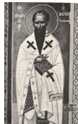
Άγιος Γρηγόριος Επίσκοπος Νύσσης - Φώτης Κόντογλου