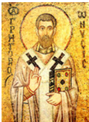
Άγιος Γρηγόριος Επίσκοπος Νύσσης