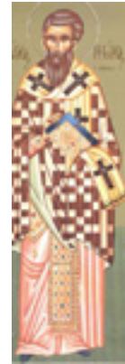
Άγιος Γρηγόριος Επίσκοπος Νύσσης