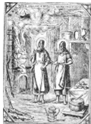
Όσιοι Σπυρίδων και Νικόδημος «οι εν τω σπηλαίω»