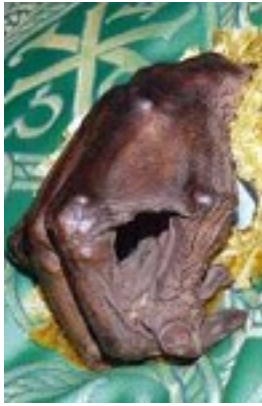
Το χέρι του Οσίου Σπυρίδωνος του προσφοράρη