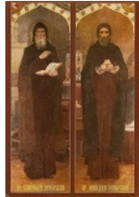
Όσιοι Σπυρίδων και Νικόδημος «οι εν τω σπηλαίω»