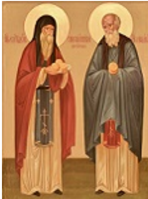
Όσιοι Σπυρίδων και Νικόδημος «οι εν τω σπηλαίω»