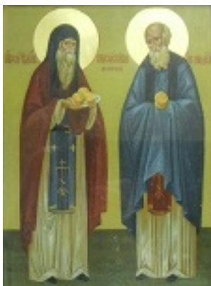
Όσιοι Σπυρίδων και Νικόδημος «οι εν τω σπηλαίω»