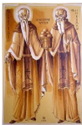
Όσιοι Σπυρίδων και Νικόδημος «οι εν τω σπηλαίω»