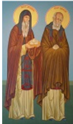
Όσιοι Σπυρίδων και Νικόδημος «οι εν τω σπηλαίω»