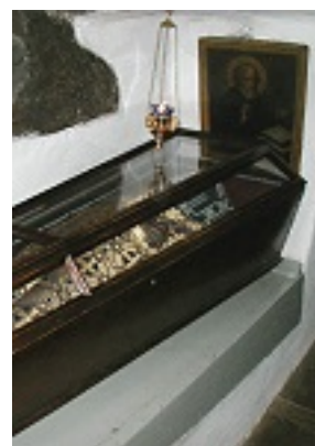
Το άφθαρτο λείψανο του Οσίου Σπυρίδωνος του προσφοράρη