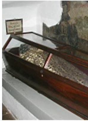
Το άφθαρτο λείψανο του Οσίου Νικοδήμου του προσφοράρη