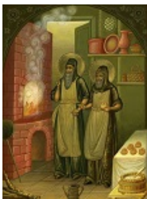
Όσιοι Σπυρίδων και Νικόδημος «οι εν τω σπηλαίω»