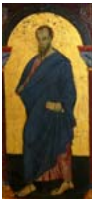
Άγιος Ιάκωβος του Αλφαίου, ο Απόστολος