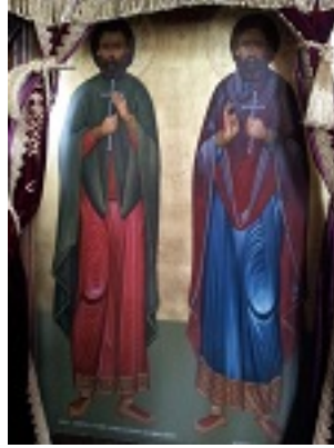
Άγιοι Ιωνάς και Βαραχήσιος