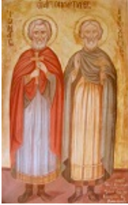
Άγιοι Ιωνάς και Βαραχήσιος