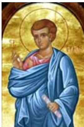
Άγιος Θωμάς ο Απόστολος