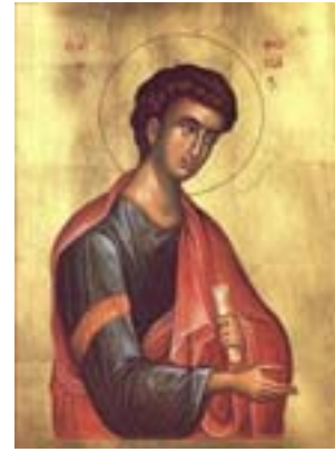
Άγιος Θωμάς ο Απόστολος