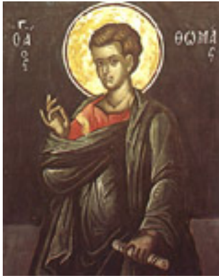
Άγιος Θωμάς ο Απόστολος