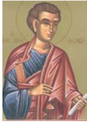
Άγιος Θωμάς ο Απόστολος