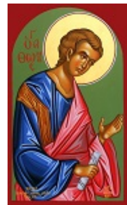
Άγιος Θωμάς ο Απόστολος - Μιχαήλ Χατζημιχαήλ