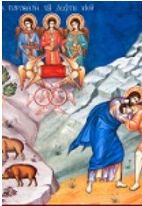
Κυριακή του Ασώτου