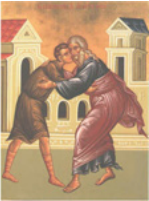
Κυριακή του Ασώτου