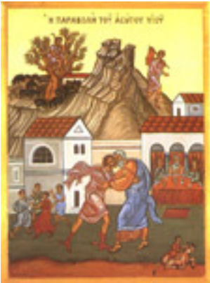
Κυριακή του Ασώτου