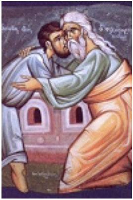
Κυριακή του Ασώτου