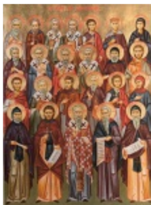
Σύναξη των εν τη Λακωνία διαλαμψάντων Αγίων