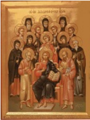
Σύναξις των εν Δωδεκανήσω Αγίων