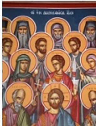
Σύναξις των εν Δωδεκανήσω Αγίων